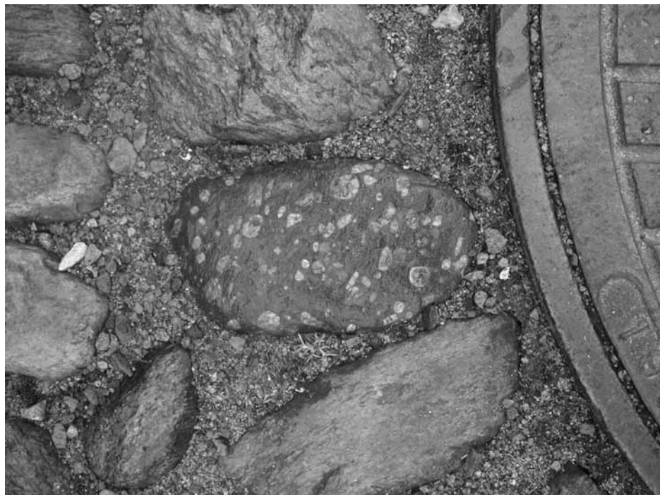
Ögongranit vid brunnslocket, Patrullgatan 5.

Jag måste erkänna att jag är helt tagen av mina kunskapsrika guider, de visar