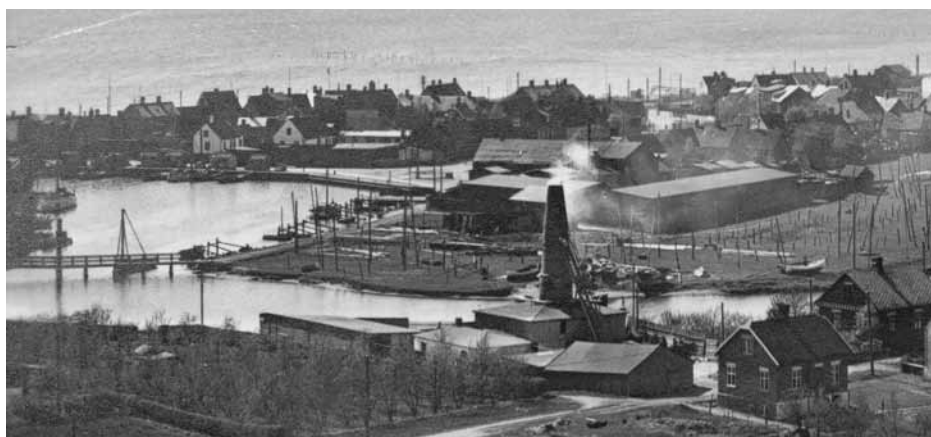
Det kortlivade kalkbruket gav Stackaresidan en ny profil under ett par decennier.