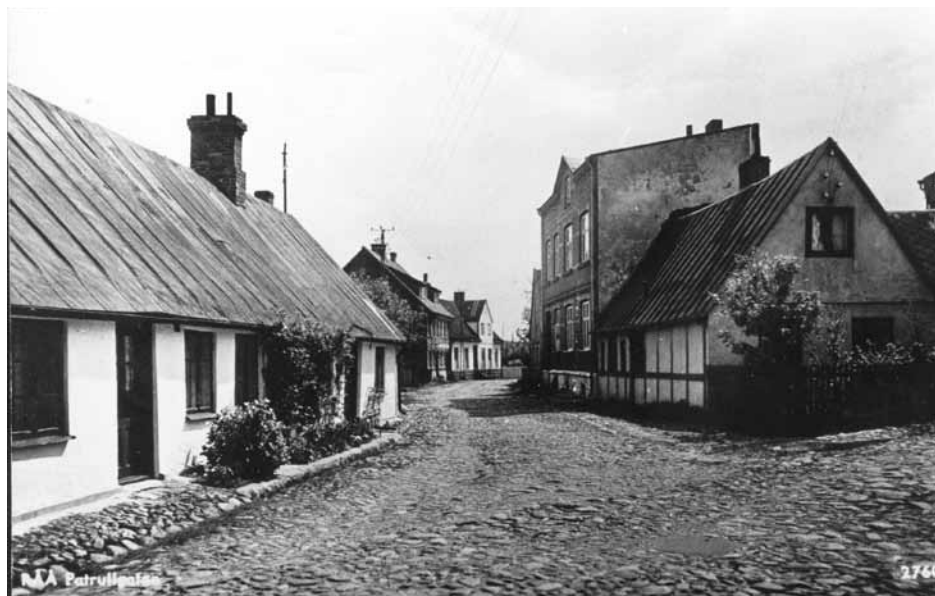
Kullerstensgatorna möts, Patrullgatan och Fiskaregatan.